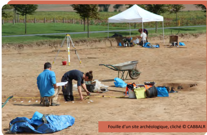
Fouille d'un site archéologique

Communauté d'Agglomération Béthune-Bruay Artois Lys Romane