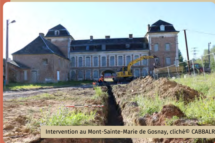
Intervention au Mont-Sainte-Marie de Gosnay

ils contribuent à en dresser la carte archéologique (inventaire cartographique de tous les sites connus, actuellement plus de 500 !); réalisent ponctuellement des fouilles programmées (sites étudiés pour leur intérêt scientifique, notamment la Chartreuse du Mont-Sainte-Marie de Gosnay et le manoir de l'Estracelles de Beuvry); intègrent des collectifs de recherche permettant d'exploiter le patrimoine archéologique local; mènent des études en partenariat avec d'autres opérateurs en archéologie, des associations et des universités. Enfin, ils apportent leur expertise à l'occasion de projets de valorisation et/ou de restauration de monuments historiques locaux ou de découvertes fortuites (Fresnicourt-le-dolmen, Béthune).