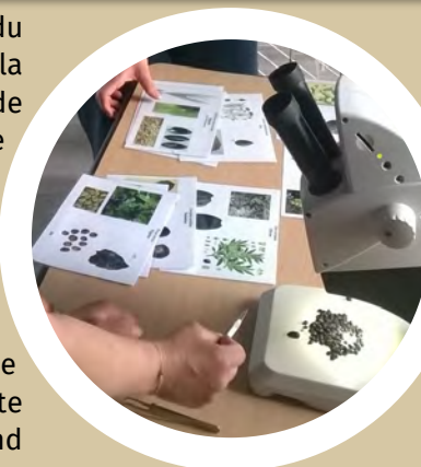
Etude carpologique (étude des graines)

Que ce soit à l'issue du diagnostic ou de la fouille, une seconde phase a lieu dite de « post-fouille ». Réalisée en laboratoire, elle consiste à étudier le mobilier et exploiter les données de terrain. Comme pour la phase terrain, la durée de cette deuxième étape dépend de la taille de l'emprise et de la concentration des découvertes : elle est généralement équivalente à la durée de la phase terrain, voire beaucoup plus longue, le temps nécessaire de réaliser l'ensemble des études et analyses. Son aboutissement consiste en la rédaction d'un rapport qui constitue, pour les générations futures, l'ultime témoignage des sites archéologiques détruits par l'aménagement du territoire.