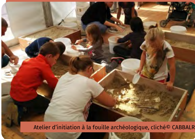
Atelier d'initiation à la fouille archéologique

Ces fabuleuses découvertes n'ont de valeur que si elles sont partagées ! Aussi, la Direction de l'archéologie de la CABBALR a pour mission de diffuser l'information scientifique auprès du grand public, par l'intermédiaire d'expositions, de conférences et d'ateliers pédagogiques, afin que celui-ci puisse prendre connaissance du riche patrimoine archéologique présent sur son territoire.