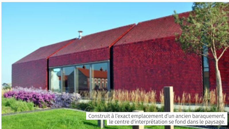
Construit à l'exact emplacement d'un ancien baraquement, le centre d'interprétation se fond dans le paysage.

Conçu par l'Agence d'Architecture Philippe Prost accompagné de l'agence Du&Ma pour la muséographie et la scénographie, il vous accueille à travers près de 1 000 m 2 de parcours libre dans deux bâtiments : l'un contemporain, l'autre ancien barreau du coron.