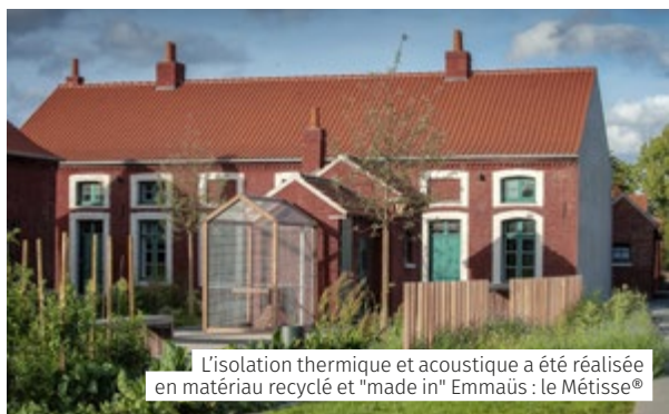
L'isolation thermique et acoustique a été réalisée en matériau recyclé et "made in" Emmaüs : le Métisse®

L'importance prépondérante des jardins-potagers dans la vie des mineurs explique l'ampleur donnée au projet paysager du site. Pédagogiques, partagés, artistiques et paysagers, les jardins sont complétés d'un verger, d'aires de jeux et de pique-nique et de places invitant à la détente. L'ensemble des espaces extérieurs, lieu d'échanges et de rencontres, est totalement ouvert et reste par conséquent accessible gratuitement à quiconque souhaite en profiter.