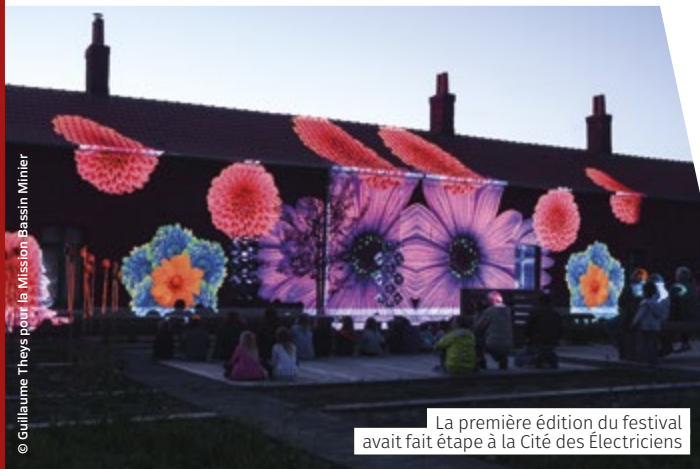
La première édition du festival avait fait étape à la Cité des Électriciens

Pour toutes les infos pratiques, les tarifs détaillés, la programmation, rendez-vous sur www.citedeselectriciens.fr